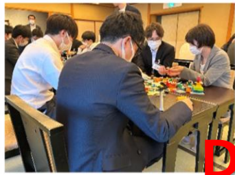
最優秀プレゼン Dチーム