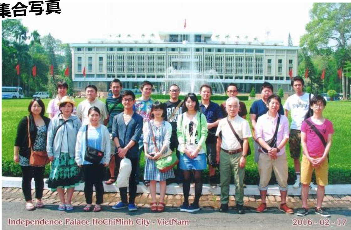
Independence Palace HoChiMinh City - VietNam